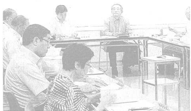
掲載拒否に委員から批判が相次いだ「さいたま市公民館運営審議会」の会合＝29日、さいたま市大宮区で